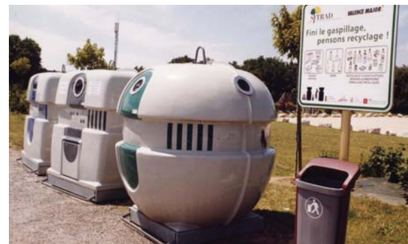
19 conteneurs sur l'ensemble de la commune

Rien qu'en investissement pour les parcs urbains et les espaces verts, ce sont 126 700 € qui seront engagés (plantations suite sécheresse, matériel d'entretien, plate-forme de déchets verts...)