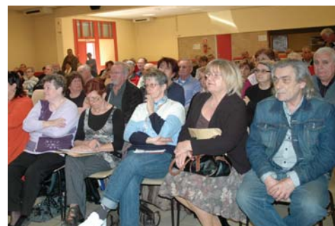
Une vue de l'assemblée

Le maire de Portes-lès-Valence a exprimé sa révolte et son indignation devant les profits extravagants du CAC 40 qui explosent : 83 milliards de profits, en augmentation de 89 % depuis 2009, alors que la crise persiste, mais manifestement pas pour les grands actionnaires. Cela est d'autant plus choquant que la misère ne fait que grandir, comme en témoigne le rapport d'activités de la Banque alimentaire. A Portes, la municipalité fait le choix politique, très concrètement de la solidarité et de l'accompagnement social, comme par