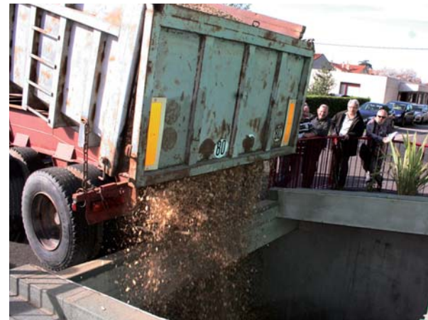
Déchargement du bois à la chaufferie de l'école Joliot Curie