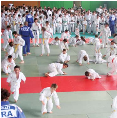
L'équipe de France rencontre 800 jeunes judokas

Avec plus de 90 clubs et associations, Portes-lès-Valence est une ville créative. Chaque structure participe du lien social, de la rencontre, de l'échange et de l'épanouissement de ses adhérents.