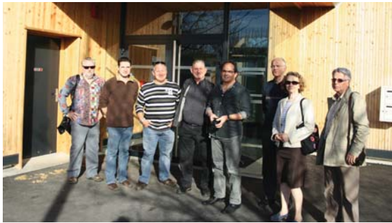
Devant la salle Fernand Léger

La semaine du développement durable s'est déroulée du 1 er au 7 avril. Mais, à Portes, son véritable coup d'envoi fut donné le samedi 26 mars lors de la fête de l'enfance et avec l'extinction de la place de la mairie dans le cadre de l'opération mondiale "Earth Hour", ce même jour de 20 h 30 à 21 h 30.