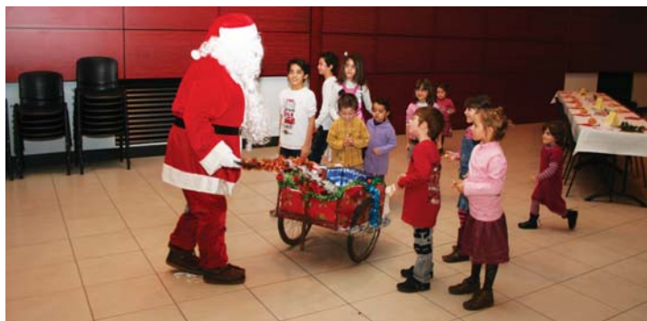
La générosité portoïse, toujours au rendez-vous

Le budget du CCAS est un élément fort de la politique d'action sociale de la municipalité, afin d'aider au mieux les habitants en difficulté. L'objectif est d'accompagner ces personnes, et non, de pratiquer l'assistanat. C'est aussi dans cet esprit que l'épicerie sociale et solidaire verra le jour, au centre commercial, fin 2011.