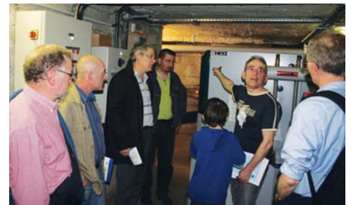
Visite de la chaufferie