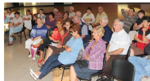
Réunion du conseil de quartier Sud

Afin de poursuivre son développement, de mener à bien ses projets de réalisation et d'amélioration du cadre de vie, de maintenir un service public de qualité, mais aussi de limiter