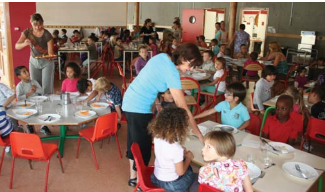
Des agents communaux impliqués au service des enfants

Qu'il s'agisse du budget de fonctionnement ou celui d'investissement, la défense du service public de l'éducation sera priorisée. Ainsi, l'école maternelle Anatole France, construite en 1953, exige des travaux de rénovation d'envergure : réfection de la charpente de l'école, construction d'un nouveau préau, isolation, menuiserie... Cette opération nécessite d'importants investissements, sur 3 ans, représentant plus de 1 118 000 €.