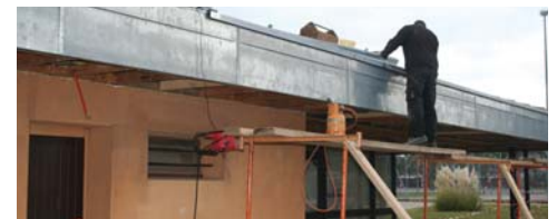
Réhabilitation du patrimoine

Par exemple : aménagement de la 3 ème tranche de la rue Descartes (451 500 €), Paul Vaillant-Couturier (340 600 €), Pierre Semard et d'autres rues (340 860 €)