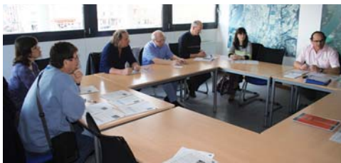
Atelier participatif d'évaluation de l'enjeu n°1

La journée du mercredi 6 avril était consacrée à la visite de la chaufferie bois de l'école Joliot-Curie et de la visite de la salle Fernand Léger, suivie d'une conférence. Ces deux réalisations sont la preuve tangible de l'implication de la Ville dans sa politique de dé-