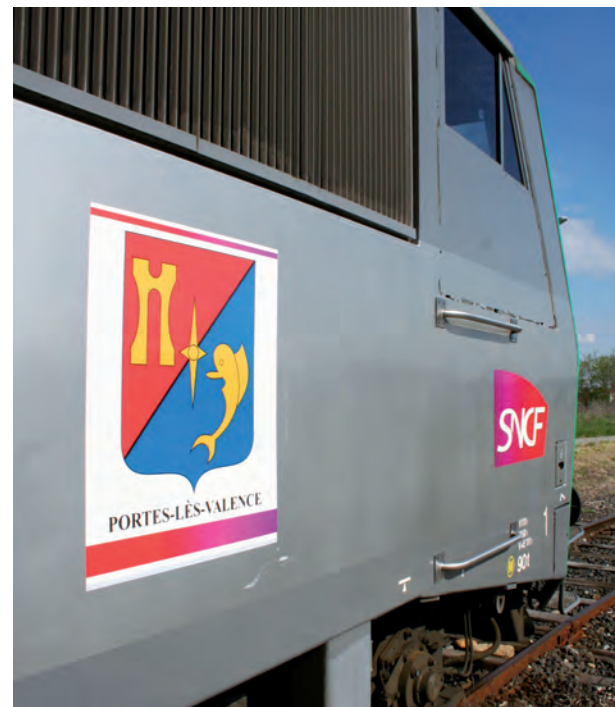
Les armoiries de Portes sur la locomotive

Pierre Trapier, après avoir commenté les armoiries de Portes, rappela le long passé de lutte et de résistance des cheminots,