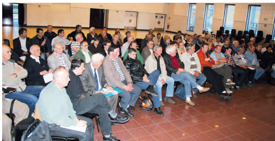
Un public nombreux, attentif, concerné et engagé pour cette nouvelle bataille du rail...