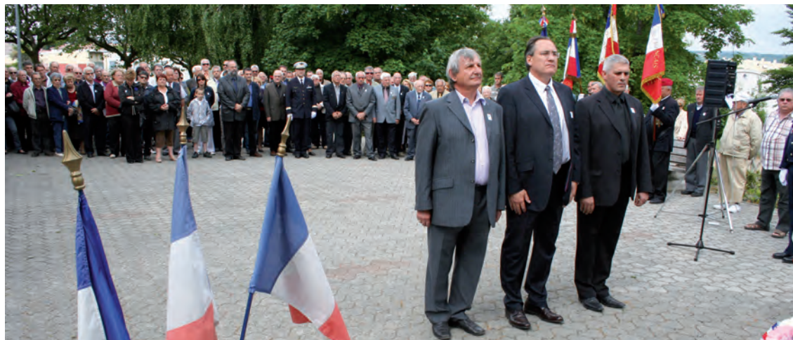
Dépôt de gerbes par la municipalité le 8 mai

« Celui qui ignore l'Histoire est condamné à la revivre ». Cette pensée d'un philosophe allemand s'applique on ne peut mieux à ce "devoir de mémoire" évoqué à chaque commémoration. Et notamment à celles du dimanche 26 avril, journée commémorative de la libération des camps de la mort, et du 8 mai, date de la capitulation de l'Allemagne nazie.