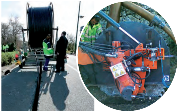
Le dérouleur et la trancheuse

Des travaux qui projettent la ville dans l'ère du numérique.