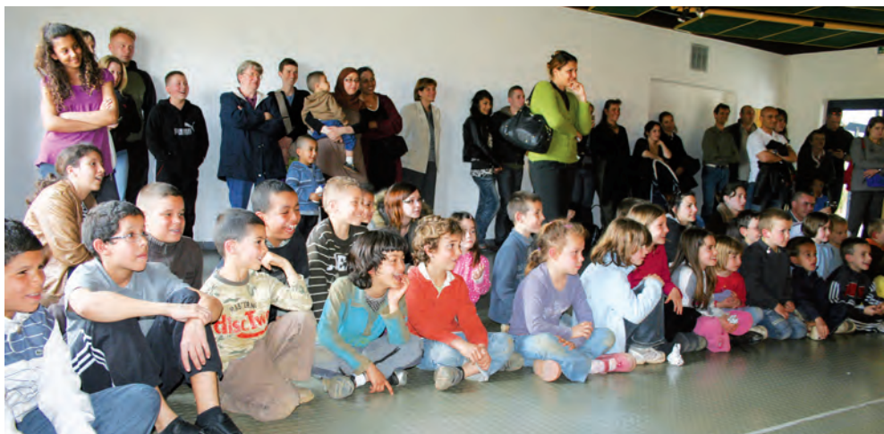
Un public d'enfants et d'adultes gagné par l'hilarité.