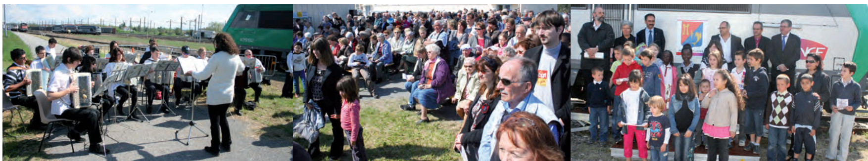
Les accordéonistes valentinois

À l'issue de la cérémonie, un apéritif était offert par le conseil de quartier Ouest, salle Fernand Léger, où Mémoire vivante de Portes exposait des photos évoquant le passé cheminot de la commune.