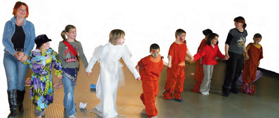
La petite troupe de "Julie au pays des fleurs"