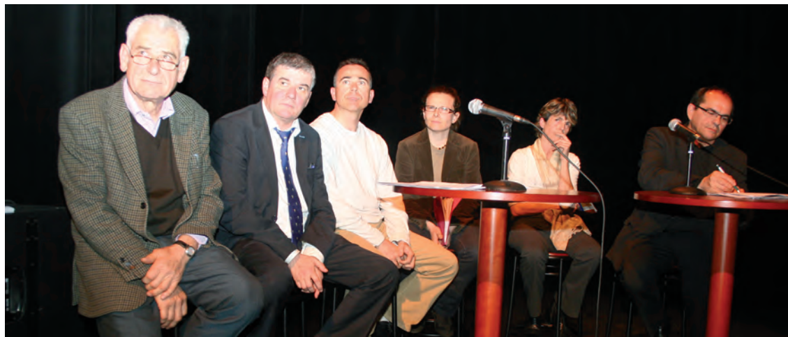
Quelques uns des intervenants du forum

Le mardi 7 avril, on a beaucoup parlé de développement durable.