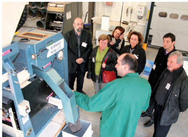
Explications aux élus dans un atelier récemment rénové